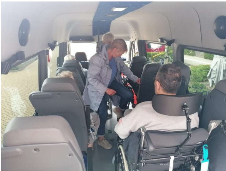
Voor koffie thee en wat lekkers, met de bus, naar de onze alternatieve bestemming.