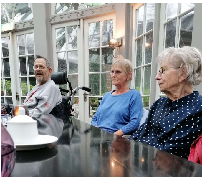
En is er voor iedereen wat te drinken en te eten.